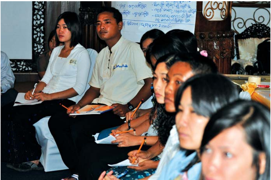
ကြိုတင်သတိပေးစနစ်များ ပိုမိုကောင်းမွန်လာရေးအတွက် မိတ်ဖက်ဖွဲ့စည်းမှုများ

အလိုက် ၎င်းတို့၏ ကျွမ်းကျင်မှုအပေါ် မူတည်၍ ရွေးချယ်ဖော်ထုတ်နိုင်ခဲ့ ကြသည်။ထိုသင်တန်းစဉ်ကိုပြည်တွင်းမှ လူမှုရေးအဖွဲ့အစည်းများအတွက် ပို့ချ ပေးခဲ့ပြီးနည်းပြများမှာမူ DRR WG အဖွဲ့ဝင်အဖွဲ့အစည်းများဖြစ်ကြသည်။