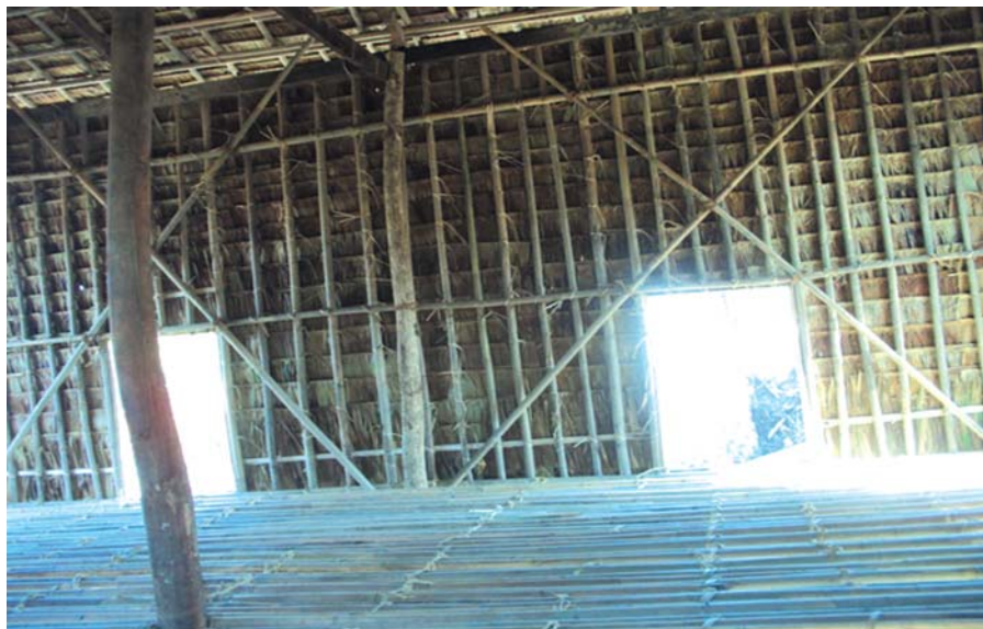
၈၄ မြန်မာနိုင်ငံ အတွင်းဘေးအန္တရာယ်လျှော့ချရေးအလေ့အထကောင်းများ

ဒေသအနေအထားနှင့် လိုက် လျောညီထွေဖြစ်စေရန်အတွက်ကိုလည်း နေအိမ်ပုံစံများကို ကျေးရွာအသီးသီးမှ ဖွံ့ဖြိုးရေးကော်မတီများအား တင်ပြ ပေးပြီး အတည်ပြုချက် ရယူခဲ့သည်။ ရရှိလာသည့်ဒီဇိုင်းပုံစံဖြင့် သရုပ်ပြ နမူနာ အိမ်တစ်လုံးကို ကျေးရွာတိုင်းတွင် စီမံ ကိန်းအဖွဲ့ကတည်ဆောက်ပေးခဲ့သည်။ ကိုယ်ပိုင်နေအိမ် ပြန်လည်ဆောက်လုပ် နိုင်ခြေအနည်းဆုံးသူအား အဆိုပါ သရုပ်ပြအိမ်ကို ရယူခွင့်ရှိသည်ဟု ရပ်ရွာ လူထုကိုယ်တိုင်က ရွေးချယ်ပေးအပ် ခဲ့သည်။ သရုပ်ပြနေအိမ်ဆောက်လုပ် ခြင်းသည် သုံးရက်ခန့်ကြာမြင့် တတ်သည်။