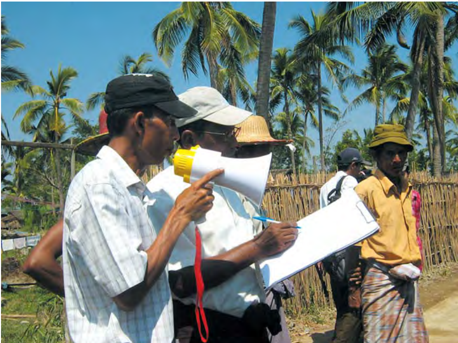
၂၂ မြန်မာနိုင်ငံအတွင်းဘေးအန္တရာယ်လျှော့ချရေးအလေ့အထကောင်းများ

အရေးကြီးလျှင် ဆက်သွယ်ရမည့် လူပုဂ္ဂိုလ်များ၊ အဖွဲ့အစည်းများစာရင်း၊ ရွှေ့ပြောင်းခိုလှုံရမည့်လုံခြုံဘေးကင်းသည့်နေရာများစာရင်း၊ ကျေးရွာအခြေပြမြေပုံတို့ပါဝင်မည်ဖြစ်သည်။ VDMC အဖွဲ့ဝင်များသည် စာမတတ်သဖြင့် ပုံစံမဖြည့်နိုင်သည့် အိမ်ထောင်စုများအား ကူညီဖြည့်စွက် ရေးသားပေးကြသည်။ သို့ရာတွင် အိမ်ထောင်စုများ၌ ပုံစံပြည့်စုံစွာရေးသွင်းနိုင်သူတစ်ဦးစီ အနည်းဆုံးရှိကြသည်။ အိမ်ထောင်စုများအနေဖြင့် စီမံချက်အတိုင်းလိုက်နာဆောင်ရွက်ရေးအတွက် VDMC မှ စောင့်ကြည့်