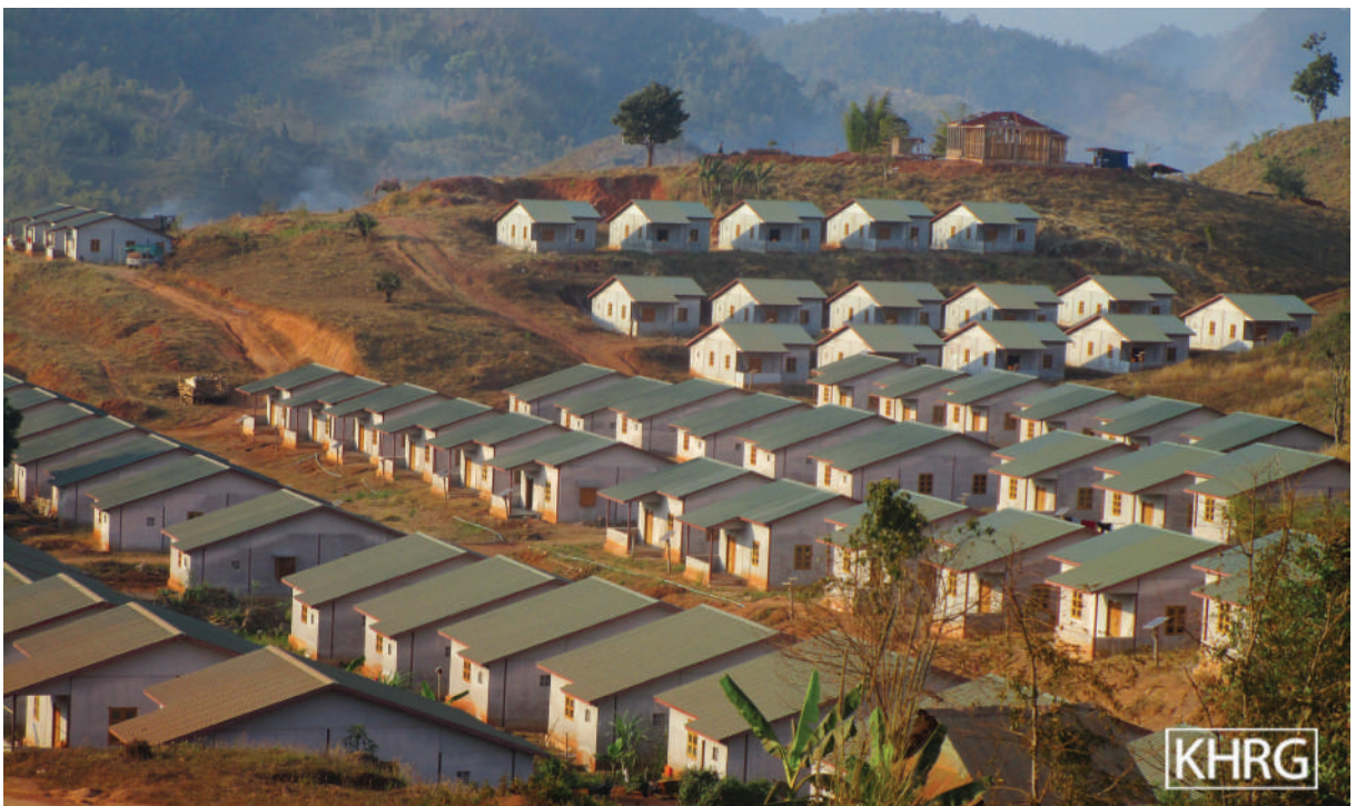
ဤပုံအား ၂၀၂၀ ခုနှစ်၊ ဖေဖော်ဝါရီလ ၆ ရက်နေ့တွင် ဒူးပလာယာခရိုင်၊ ကော်တရီ(ကျော့ကရိတ်)မြို့နယ်၊ ကော်လားကျေးရွာကို ရိုက်ယူခဲ့သည့် ဗီဒီယိုထဲမှပုံကိုပြန်လည်ယူထားခြင်းဖြစ်ပါသည်။ ကော်လားကျေးရွာသည် နေရပ်ပြန်သူများအတွက် ချမှတ်ထားသည့် ပြန်လည်နေရာချထားရေးနေရာထဲတွင် တစ်ခုအပါအဝင်ဖြစ်ပါသည်။ ဤပုံသည် ဒုက္ခသည်များနှင့် IDP နေရပ်ပြန်သူများအတွက် အသစ်ဆောက်လုပ်ထားသော အိမ်အလုံး (၃၀၀) ၏ ပုံဖြစ်ပါသည်။