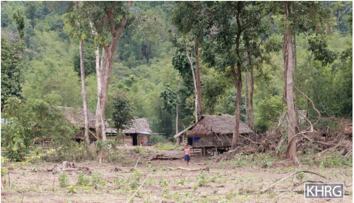
ဤပုံအား ၂၀၁၇ ခုနှစ်၊ ဇွန်လ ၂၄ ရက်နေ့တွင် ခလယ်လွီတူ(ညောင်လေးပင်)ခရိုင်၊ မူး(မုန်း)မြို့နယ်၊ မရမ်းပင်ကျေးရွာတွင် ရိုက်ယူခဲ့ပါသည်။ ဤပုံသည် မရမ်းပင်ကျေးရွာသို့ ပြန်လည်နေထိုင်ကြသော IDPများ၏အိမ်များပုံ ဖြစ်ပါသည်။