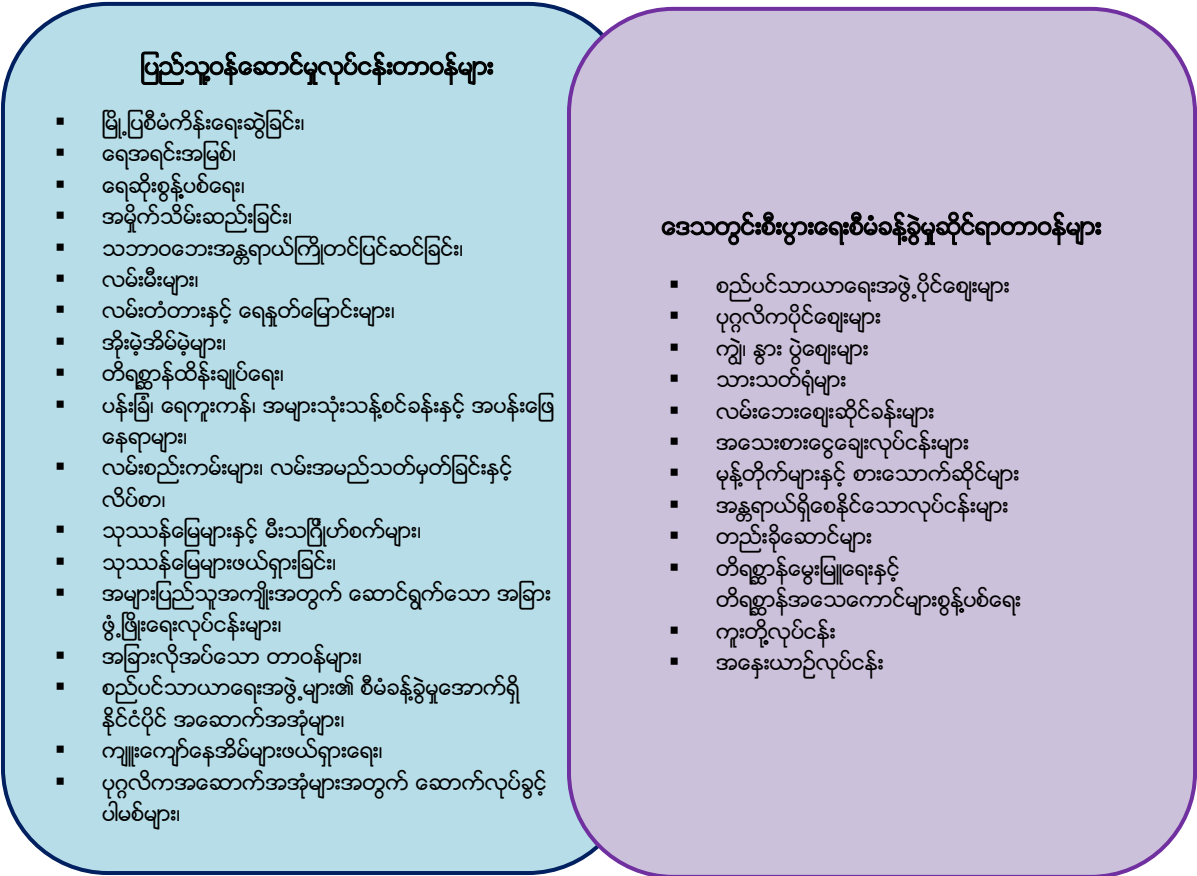
ပုံ- ၁။ စည်ပင်သာယာရေးအဖွဲ့များ၏ လူမှုဝန်ဆောင်မှုများနှင့် စီးပွားရေးစီမံကွပ်ကဲမှုဆိုင်ရာ တာဝန်များနှင့် လုပ်ငန်းရပ်များ 34