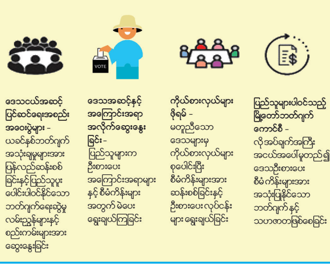
ပုံ - ၅။ ၎င်းကိစ္စအတွက် ပိုမိုကောင်းမွန်သော ဆုံးဖြတ်ချက်ချမှတ်ရေးကဏ္ဍတစ်ခုအား ဘတ်ဂျက်ရေးဆွဲခြင်းတွင် လွှမ်းမိုးနိုင်စေရန် အဆင့်များမြှင့် ဖော်ဆောင်ခြင်းဖြစ်သည်။ ဤဖြစ်ရပ်များကို သမားရိုးကျနည်းလမ်းများအတိုင်း ပြန်လည်မွမ်းမံအသုံးပြုခြင်းအားဖြင့် တနင်္သာရီတိုင်းဒေသကြီးအတွက် အကျိုးပြုနိုင်ပါသည်။

ဘတ်ဂျက်ရေးဆွဲရာတွင် ဒေသပြည်သူများ၏ လိုအပ်ချက် ဦးစားပေးမှုများနှင့် ကိုက်ညီမှု ရှိစေရန်