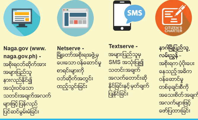
ပုံ - ၂။ ၎င်းကိစ္စအစိုးရပူးပေါင်းဆောင်ရွက်မှုများဖြင့် ပြည်သူလမ်းညွှန်စာအုပ်ဖန်တီးခြင်းနှင့် SMS စာတိုစစ်ကို အသုံးပြုခြင်းကို တနင်္သာရီတိုင်းအစိုးရအတွက် အသင့်တော်ဆုံး ဆက်သွယ်ရေးလမ်းကြောင်းအဖြစ် အသုံးပြုနိုင်ပါသည်။

ပိုမိုတာဝန်ခံမှုရှိပြီး အချိန်မဆိုင်တုံ့ပြန်မှုရှိသော အစိုးရတစ်ရပ်ဖော်ဆောင်ရန်နှင့် အစိုးရဝန်ထမ်းများအား ပိုမိုဆန်းသစ်သော ချဉ်းကပ်မှုပုံစံများဖြင့် ဖြေရှင် စီမံခန့်ခွဲမှုများပြုလုပ်နိုင်ရန်ဖြစ်သည်။