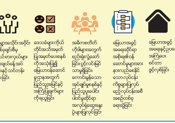
ပုံ - ၃။ ၎င်းကိစ္စအဆင့်အလုပ်ရုံဆွေးနွေးပွဲ၏ ရလဒ်များအရ မြေယာမှတ်ပုံတင်ခြင်းလုပ်ငန်းစဉ်၏ ရပ်တန့်မှုနှင့် တနင်္သာရီတိုင်းဒေသကြီးအတွင်း ထိုလုပ်ငန်းစဉ်နှင့် ဥပဒေအသိပညာပိုင်းဆိုင်ရာ ခေါင်းစဉ်များအား ထောက်ပြနေပါသည်။ မာဒါဂါစကာနိုင်ငံတွင်ပြုလုပ်ခဲ့သော မြေယာပိုင်ဆိုင်ခွင့်ပိုင်ဆိုင်မှုသည် ယခုကဲ့သို့သော ပြဿနာကို ဖြေရှင်းရန်ဖြစ်သည်။

မြေယာပိုင်ဆိုင်ခွင့်နှင့် ငြိမ်းချမ်းရေးတည်ဆောက်ခြင်း အစိုးရပူးပေါင်းဆောင်ရွက်ပေးသည့် မြေယာပိုင်ဆိုင်ခွင့်အခြေအနေများ ရယူအသုံးပြုမှုများ တိုးတက်လာစေရန်နှင့် အစိုးရဌာနအဖွဲ့အစည်းများမှ ပေးနေသည့် ဝန်ဆောင်မှုများကို ပြည်သူများကိုယ်တိုင် ပါဝင်လျက် သုံးသပ်မှုများပြုလုပ်ခြင်းဖြင့် ဝန်ဆောင်မှုအရည်အသွေးမြှင့်တင်ရန်တို့ဖြစ်သည်။