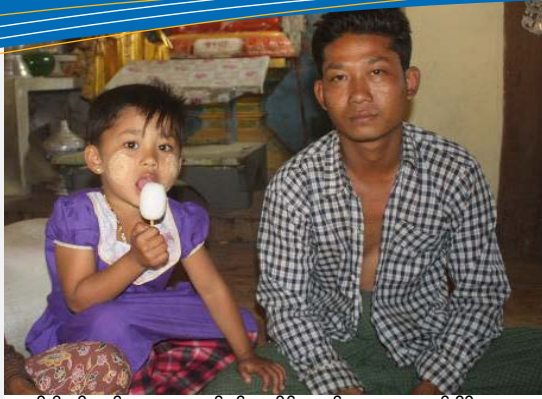
လားရှိုးရှိ ကိုးကန့်ဒေသမှ နေရပ်စွန့်ခွာတိမ်းရှောင်သူများ၊ ဖေဖော်ဝါရီ ၂၀၁၅၊ ဓာတ်ပုံ OCHA