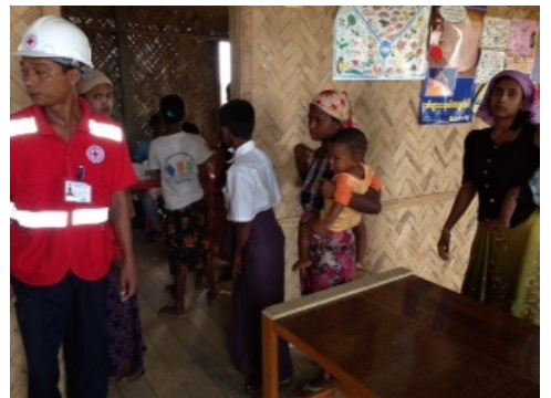
၂၀၁၄ မေတွင် သက်ကယ်ပြင်စခန်းသို့ ရွှေ့လျားကျန်းမာရေးအဖွဲ့ သွားရောက်ခဲ့စဉ်။ MMA

နိုင်ငံတကာနှင့် ပြည်တွင်းရှိ ကျန်းမာရေး အဖွဲ့အစည်းများအနေဖြင့် ရခိုင်ပြည်နယ်တွင်းရှိ ဝေးလံခေါင်သီသောနေရာများရှိ ရပ်ရွာ လူထုများနှင့် စခန်းများရှိနေရပ်စွန့်ခွာတိမ်းရှောင်သူများ ကျန်းမာရေးစောင့်ရှောက်မှုများ ရရှိစေရန် ဆောင်ရွက်ပေးခြင်းဖြင့် ရခိုင်ပြည်နယ် ကျန်းမာရေးဌာနကို ပံ့ပိုးကူညီပေးလျက်ရှိသည်။ သို့သော် အခက်အခဲများစွာရှိနေဆဲ ဖြစ်ပြီး အထူးသဖြင့် အပြင်း အထန်