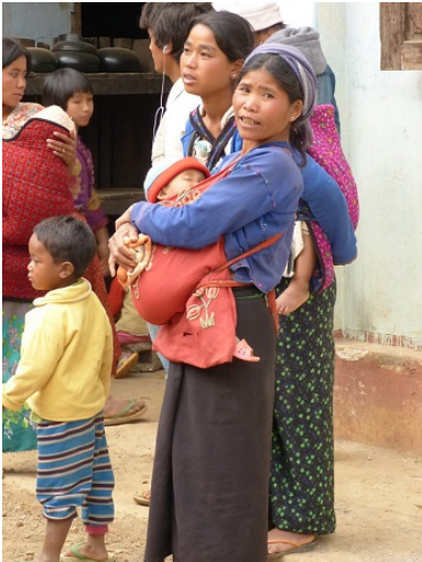
ကွတ်ခိုင်ရှိ နေရပ်စွန့်ခွာတိမ်းရှောင်သူစခန်းမှ မိသားစုများ၊ ဖေဖော်ဝါရီ ၂၀၁၅။

ရှမ်းပြည်နယ်မြောက်ပိုင်းနေရာအချို့တွင် ဒေသတွင်း တိုက်ပွဲများနှင့် လုံခြုံရေးအခြေအနေများကြောင့် နေရပ်စွန့်ခွာတိမ်းရှောင်မှုများ ထပ်မံဖြစ်ပေါ်ခဲ့ပြီး လူသားချင်းစာနာမှုဆိုင်ရာ အကူအညီပေးရေးလုပ်ငန်း များ ထိခိုက်ခဲ့သည်။ ထိုဒေသများရှိ ပြည်တွင်းနှင့် နိုင်ငံတကာ လူသားချင်းစာနာမှုဆိုင်ရာ အကူအညီ ပေးရေးအဖွဲ့အစည်းများ၏ ပြောကြားချက်များအရ ကွတ်ခိုင်၊ သိန်းနီ၊ မူဆယ်နှင့်နမ့်ခမ်း မြို့နယ်များအပါ အဝင်နေရာများတွင် ဖေဖော်ဝါရီလအတွင်း ရာနှင့်ချီသော လူများ ထပ်မံနေရပ်စွန့်ခွာတိမ်းရှောင်ခဲ့ရသည်။ ရှမ်းပြည်နယ် မြောက်ပိုင်း၊ မိုးမိတ်မြို့နယ်တွင် မြန်မာ့ တပ်မတော်နှင့် ပလောင်အမျိုးသား လွတ်မြောက်ရေး တပ်မတော်တို့ အကြား ဖြစ်ပွားခဲ့သည့် တိုက်ပွဲများကြောင့် မန္တလေးတိုင်းဒေသကြီး အတွင်းရှိ မိုးကုတ်မြို့သို့ လူပေါင်း ၆၀၀ ကျော် နေရပ် စွန့်ခွာ တိမ်းရှောင် ခဲ့ရသည်။ ပြည်နယ်အကာကပိုင်များ၏ ပြောကြား ချက်အရ မိုးကုတ် ဒေသသို့ နေရပ်စွန့်ခွာ တိမ်းရှောင်ခဲ့သူ အားလုံး ဖေဖော်ဝါရီလကုန်တွင် ၎င်းတို့၏ မူလနေရပ်သို့ ပြန်သွားပြီ ဖြစ်သည်။