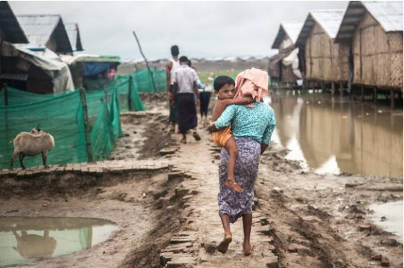
၂၀၁၄ခုနှစ် မိုးရာသီအတွင်း ငှက်ချောင်းစခန်း၊ ဓာတ်ပုံ OCHA

များမှာ ယာယီ အသုံးပြုရန် အတွက်သာ ဆောက်လုပ် ထားခြင်းဖြစ်သည့် အတွက် UNHCRနှင့် Lutheran World Federation တို့၏ပြောကြားချက်အရ ၂နှစ်ကျော်ကြာမြင့် လာချိန်တွင် ချက်ချင်း ပြုပြင်ရန်၊ ပြန်လည် တည်ဆောက်ရန် လိုအပ်လျက် ရှိသည်။ အချို့ နေထိုင်ရာ နေရာများတွင် ကြမ်းခင်း များ ပြိုကျ ပျက်စီးနေပြီး၊ နံရံများမှာ လေဒက်ကြောင့် ပျက်စီး နေသည်။ ခြေတံရှည်အိမ်များ၏ ကြမ်းခင်းများတွင် ကြီးမားသော အပေါက် များ ရှိနေသည့် အတွက် နေထိုင် နေသော လူများ၊ အထူး သဖြင့် ကလေးများအတွက် ကြီးမားသော အန္တရာယ် ရှိနိုင်သည်။ လက်ရှိ နေထိုင်သည့် နေရာများမှာ ဆက်လက် နေထိုင်၍ မရနိုင်တော့သည့် အတွက်ကြောင့်